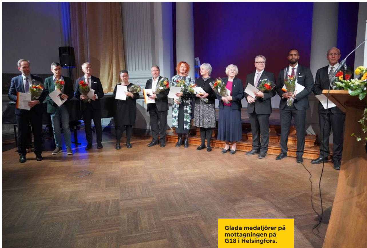
Glada medaljörer på mottagningen på G18 i Helsingfors.