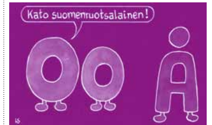
Pohjalainen pilapiirtäjä Leif Sjöström