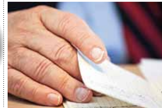
FREDSFÖRHANDLARE. Martti Ahtisaari on tehnyt pitkän uran rauhansovittelijana.

En usko, että kieliryhmien välille syntyy Suomessa vakavia ristiriitoja.