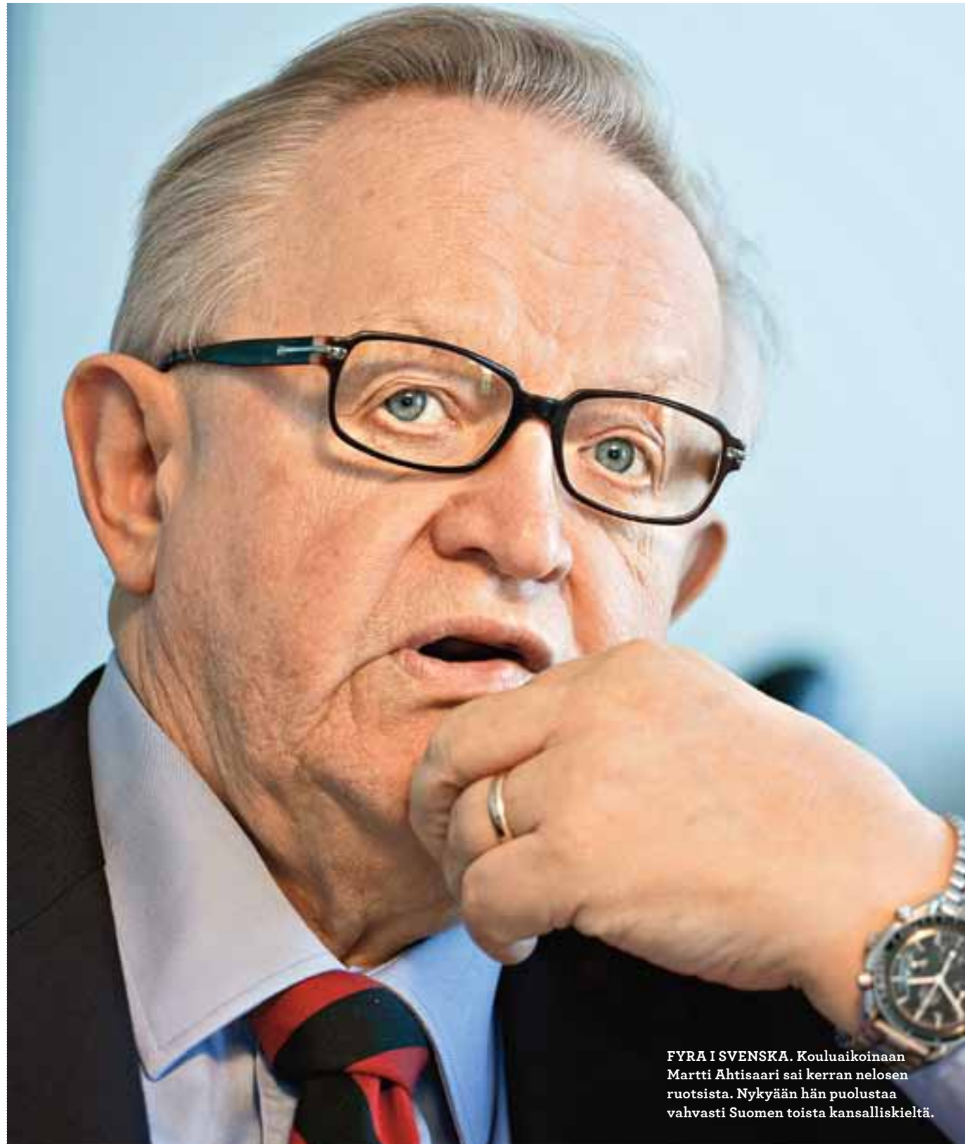
FYRA I SVENSKA. Kouluaikoinaan Martti Ahtisaari sai kerran nelosen ruotsista. Nykyään hän puolustaa vahvasti Suomen toista kansalliskieltä.